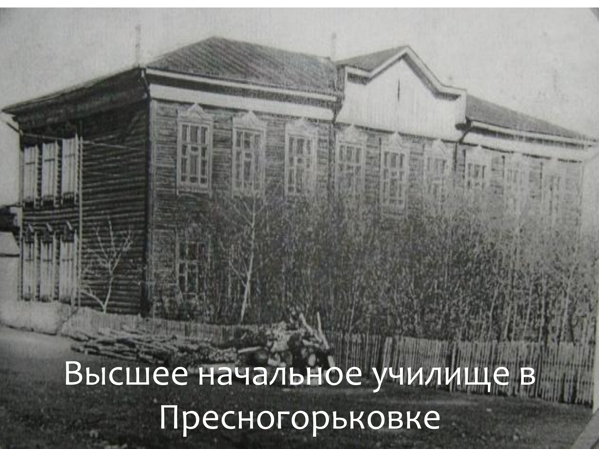
Высшее начальное училище в Пресногорьковке